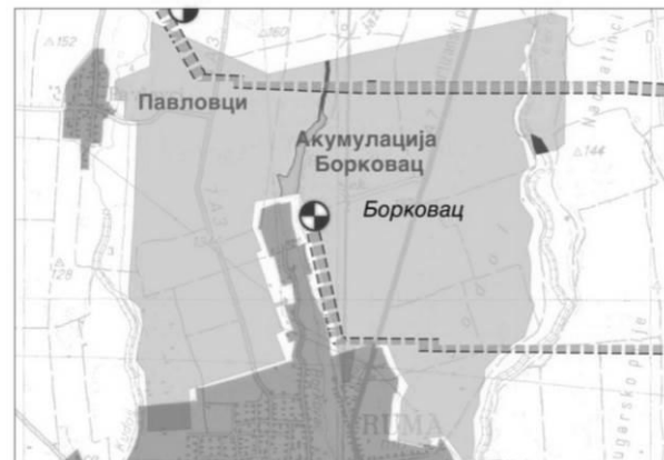
Слика 50. Подсистем Борковац

Подсистем Борковац (2.032 ha) чине површине на котима од 100,00 до 120,00 mАНВ. Подсистем се базира на цевној мрежи са пумпањем директно у мрежу, преко црпне станице високог притиска „Борковац“, капацитета 1,70 m 3 /s (16-часовни рад) и висине дизања 30 m. За главни напојни вод пречника 0,8 m (дужине око 100 m до тежишта површине) потребна снага црпне станице била би 770 kW. Притисци у систему се крећу између 2,5 и 4,0 бара.