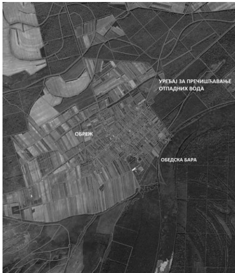
Слика 1 – Положај обухвата Плана у ширем окружењу

Простор обухвата Плана се налази североисточно од насеља Обреж. (Југоисточно од насеља Обреж налази се насеље Купиново на самој обали Обедске баре).