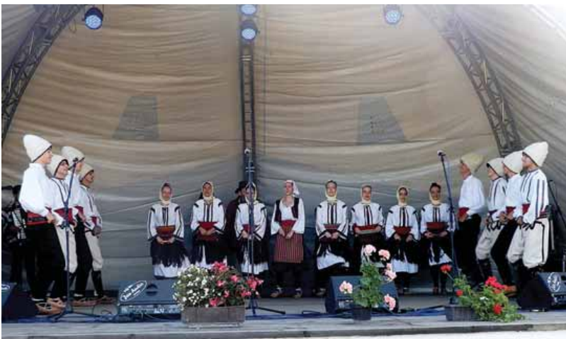
Igre iz Srbije