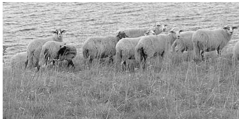
Povesti računa o higijenskoj ispravnosti hrane za ovce

Uz faktor ishrane u ispoljavanju digestivnih poremećaja važnu ulogu igraju i loši zoohigijenski uslovi držanja. Uzročnici oboljenja su u najvećem broju slučajeva stanovnici digestivnog trakta zdravih ovaca. Izlučuju se u spoljašnju sredinu i čine podlogu za ispoljavanje poremećaja. Ukoliko se ovce hrane sa tla bez odgovarajućih hranilica, to je jedan od preduslova za oboljenja. Lošiji uslovi su povezani sa periodom jagnjenja, koje se uglavnom odvija u hladnije doba godine. Ovce tada nisu na ispaši, manje se kreću, ako se u ovčarnicima ne upotrebljava prostirka slame, stvaraju se uslovi za poremećaje. Neredovno čišćenje ovčarnika gde se staj-