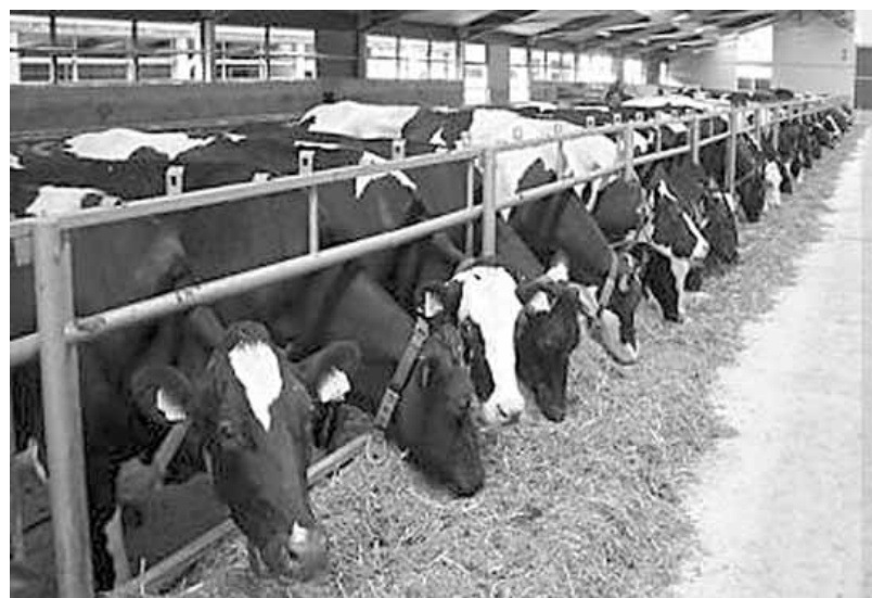
Milioni za stočarstvo

Pokrajinski sekretarijat za poljoprivredu, vodoprivredu i šumarstvo objavio je konkurse iz Programa stočarstva. Reč je o raspodeli sredstava za sprovođenje Godišnjeg programa mera kod odgajivačkog programa u AP Vojvodini za 2013 godinu, o raspodeli sredstava za očuvanje i održivo korišćenje genetskih resursa domaćih životinja u AP Vojvodini za 2013 godinu, o raspodeli sredstava za odr-