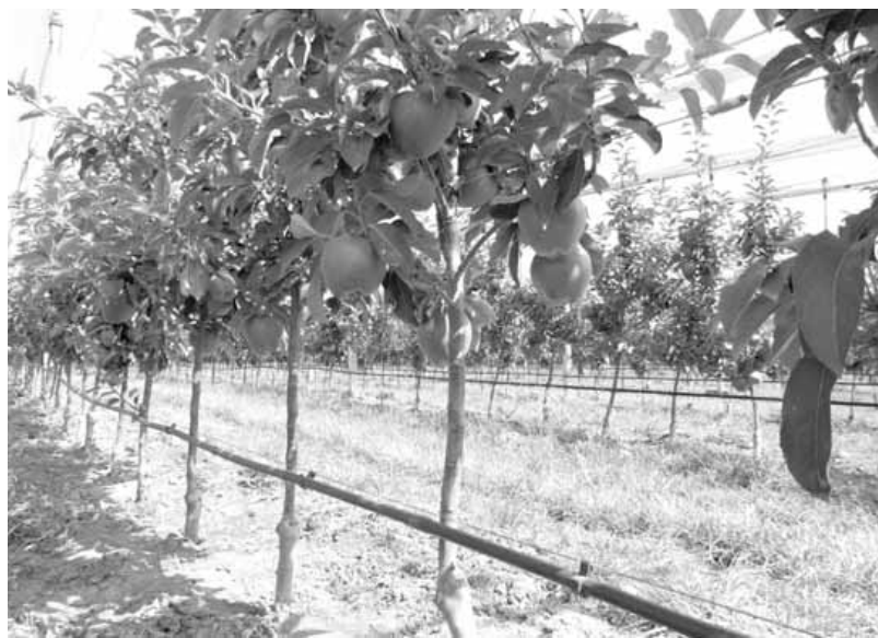
Zalivni sistem u intenzivnoj proizvodnji (Mala Remeta)

Ne smete mnogo ni navodnjavati da ne dođe do truljenja korena ili napada staklokrilca. Bilo je i slučajeva gde se navodnjavalo a da se nisu obrazovali pupoljci za sledeću godinu. Zato morate voditi računa o normama.