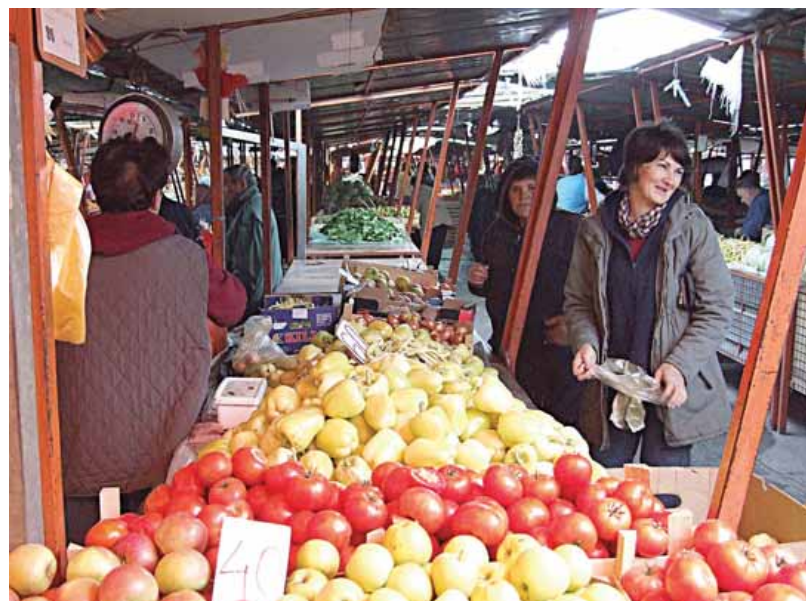
Sve je manje kupaca