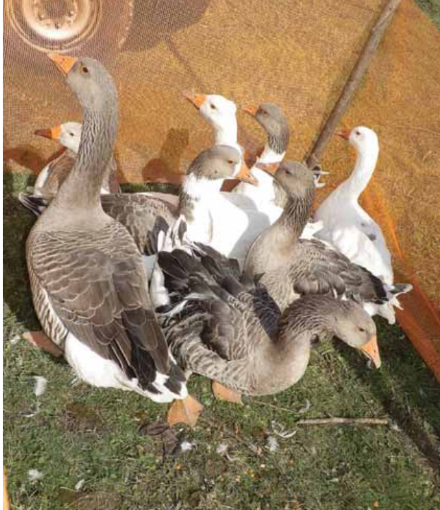
Doterane za paradu