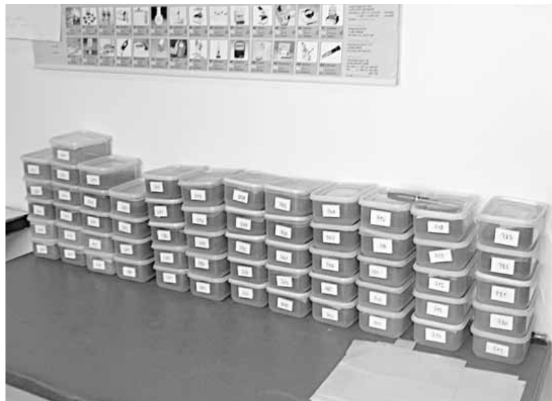
Spremni za analizu

- Pokazala je da su naša zemljišta siromašna fosforom i da treba raditi u pravcu njegovog povećanja. Preporukama mi to regulišemo, a poljoprivrednicima preporučujemo da treba da poštuju date formulacije, jer je to veoma bitno i u protivnom od ovog posla neće biti nikakve koristi. Istina, sve je više mladih poljoprivrednika koji dolaze i donose sami uzorke zemljišta bez naše pomoći i traže analizu, jer vide da je neophodna za proizvodnju. Vide da je hemijska analiza temelj ratarske proizvodnje. zato mi ne samo da dajemo preporuku oko đubrenja, već i savete proizvođačima koji hoće da zasade višegodišnje zasade. Ukratko, savetujemo ih da li je konkretno zemljište pogodno za to ili nije. Jer, ima zemljišta koja nisu pogodna za višegodišnje zasade zbog kiselosti ili nekog drugog razloga, a na nama je obaveza da to navedemo u preporuci - objašnjava Kovačević.