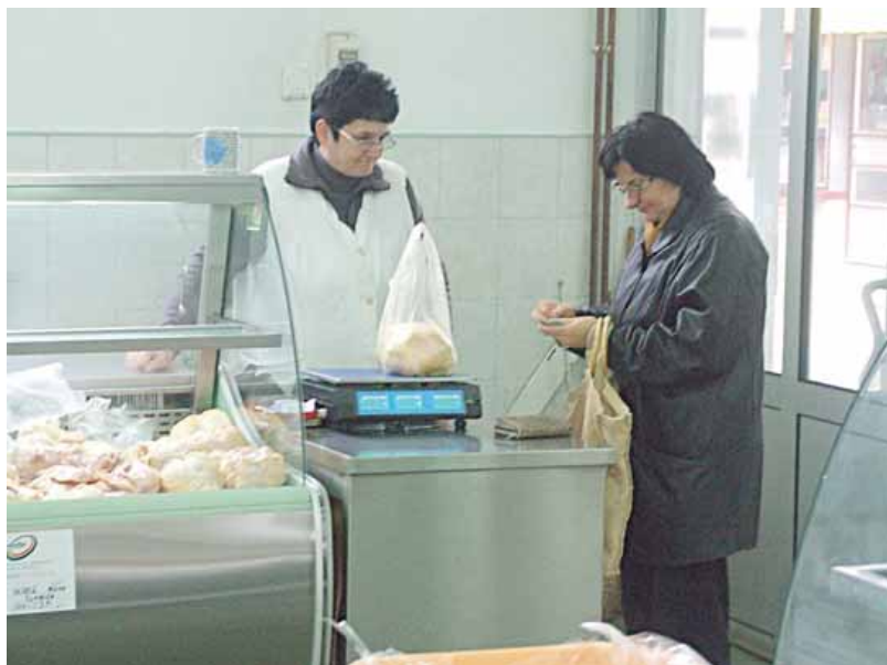
I meso se kupuje na komad