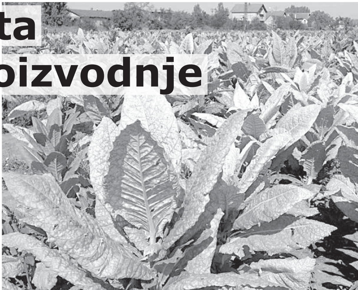
Umesto povećanja proizvodnje, postali smo uvoznici duvana

- Hrvatska ima premiju od jednog evra, a mi nemamo mogućnost da ni kilogram duvana prodamo u tu državu. Regulisala je to zakonima kojima je suština da štite hrvatsku proizvodnju. Nama kao da su zakon pisali drugi, ali da unište domaću proizvodnju duvana. I Makedonija je svoju proizvodnju zaštitila ovako: u paklicu se stavi 19 cigareta, plaća se 20, ali se to kroz budžet vraća proizvođačima sirovine u vidu premije od svake prodate paklice. Mi sa nji-