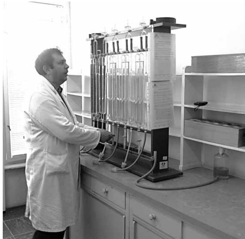
Detalj iz laboratorije

Poljoprivredna stručna služba "Sremska Mitrovica", odnosno hemijska laboratorija, ima sve što je neophodno za aktuelan posao oko zemljišta. Ovo se odnosi pre svega na adekvatno opremljenu laboratoriju i sttučnjake, jer je istina u ranijem dugom nizu godina, taj posao finansirala pokrajina, a ove godine obavezu je preuzela Gradska uprava za poljoprivredu Grada Sremska Mitrovica.