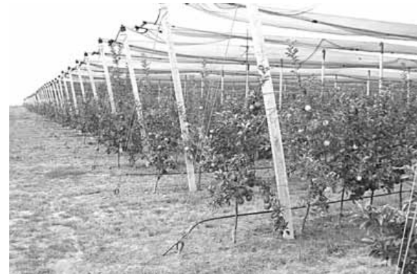
Integralna proizvodnja, savremen zasad jabuka

- Gde smo mi u voćarstvu najviše pravili greške? Uradili smo dosta na uvođenju savremenih tehnologija