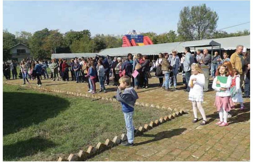
U publici i veliki i mali

- Ovo je jedan od onih dana kada se podigne celo selo, jer svako želi da da svoj doprinos opštem veselju. Ako nekoga zanima šta su Šatrinčani i kakvi su Šatrinčani, treba da poseti „Guščijadu“. To smo mi, to je ono što nas čini onim što jesmo i što želimo da budemo. Ovde je život čoveka i guske sjedinjen i bez obzira što broj gusaka opada, mislim da će Šatrinčani živeti dokle god ima i jedne bele ili crne guske u našim dvorištima ili na našim sokacima. Sad, kako smo mi ljudi koji vole da žive, to će, siguran sam, biti i gusaka, rekao je Greč.