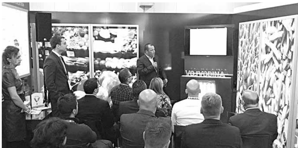
Predstavljanje vojvođanskih potencijala u Kelnu

- Naš izvoz trenutno iznosi 3,6 milijardi dolara na nivou Srbije i da-