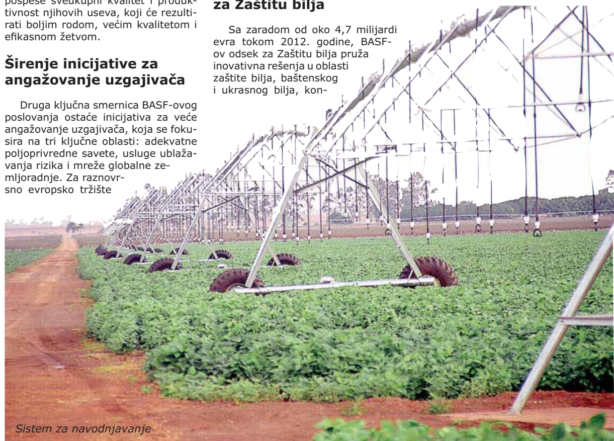
Sistem za navodnjavanje

Druga ključna smernica BASF-ovog poslovanja ostaće inicijativa za veće angažovanje uzgajivača, koja se fokusira na tri ključne oblasti: adekvatne poljoprivredne savete, usluge ublažavanja rizika i mreže globalne zemljoradnje. Za raznovrsno evropsko tržište