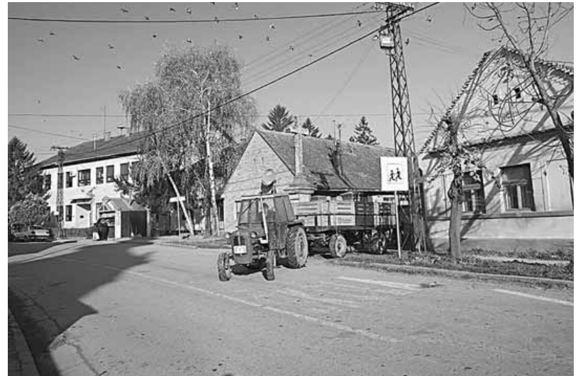
Susek - selo sa najboljom zemljom

- Interesovanje za zakup državnog poljoprivrednog zemljišta u opštini Beočin iz godine u godinu se sve više povećava. Prošle godine, na primer, od ukupno 550 hektara državnog zemljišta, predviđenog za licitaciju, u zakup je izdato oko 315 hektara. To je značajan procenat, s obzirom da se dobar deo zemljišta u državnoj svojini odnosi na livade i pašnjake, odnosno nije pogodan za obradu. Srazmerno većem interesovanju, povećavaju se i cene postignute na licitaciji. Tako je prilikom nadmetanja, 2012. godine, za zemljište po kulturi "njiva" postignuta cena od 140 evra po hektaru.