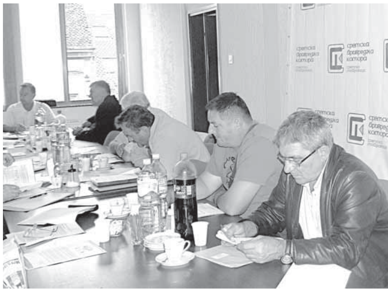
Sa sednice u Sremskoj privrednoj komori

Zato je među zaključcima o ovoj temi sa pomenute komorske sednice i podsećanje da Evropska unija i države u okruženju neuporedivo više štite i subvencionišu ovu proizvodnju od naše države. Umesto da povećavamo proizvodnju duvana mi smo je pogrešnom politikom, smatraju učesnici sastanka, doveli u fazu stagnacije tako da smo postali veliki uvoznici umesto velikog proizvođača duvana. Ovi zaključci će, uz sve ostale, biti prosleđeni nadležnom republičkom ministarstvu.