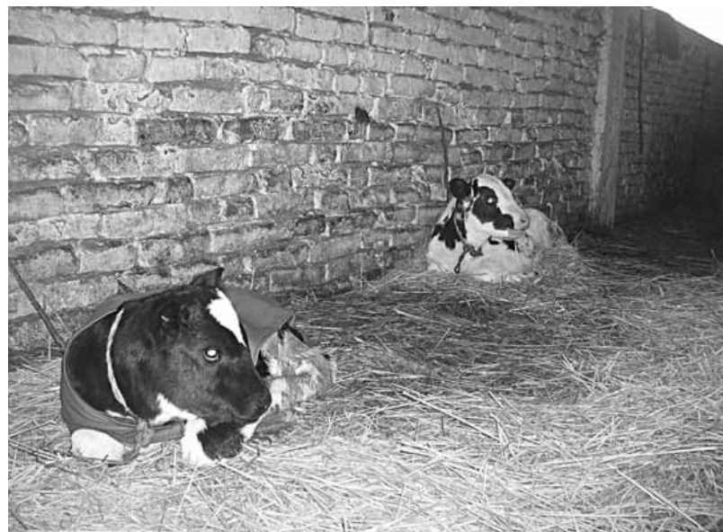
Bolje držati krave nego krmače

- Velike pare vam prolaze kroz ruke, a samo jedan deo zaradite. Dok se plati repromaterijal i sve ostalo vama šta ostane. U svakom slučaju mislim da mnogo zdravije