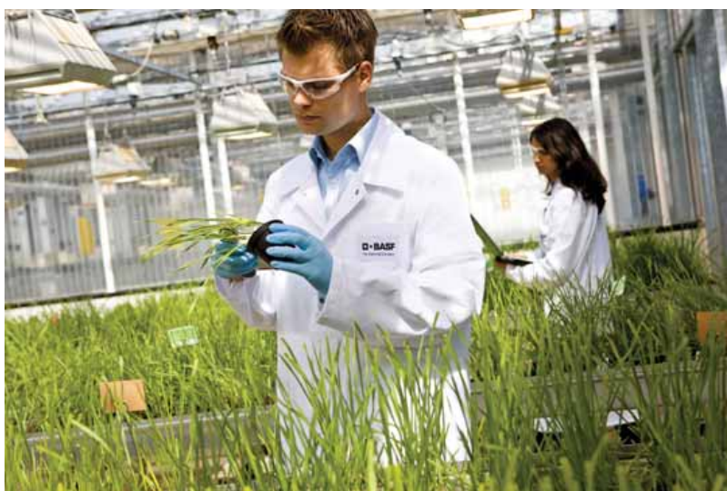
Budućnost zaštite bilja

Za BASF-ove proizvode za zaštitu bilja koji su još u razvoju, a koje predstavljaju proizvodi koji će biti lansirani između 2010. i 2020. godine, najveći ukupni iznos od prodaje procenjuje se na 1,7 milijardi evra, što je 500 miliona evra više nego lane. Vrednost budućih proizvoda u velikoj meri je poduprta već uspešno lansiranim proizvodima. Značajan doprinos očekuje se i od Xemium-a, od novih herbicida i rešenja vezanih za otpornost na herbicide koji obećavaju, kao i proizvoda iz oblasti Funkcionalne zaštite bilja. Kako bi ostvario zacrtane ciljeve BASF će istrajati u svojoj odluci da uložiti oko 9% prodaje odseka za Zaštitu bilja u