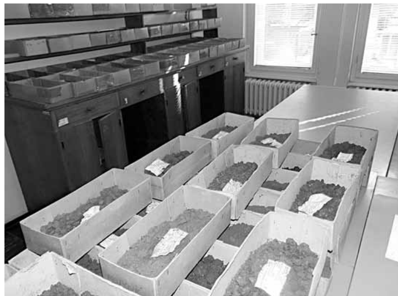
Uzorci zemljišta uzeti na njivama