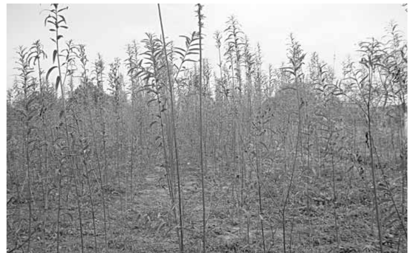
Zasad energetske vrbe u prvoj godini

- Na Zapadu postoji kompletna mehanizacija stvorena za korišćenje i eksploataciju energetskih zasada. Kombajn za sečenje i pravljenje tzv. „čipsa“ koji se koristi u toplanama, zatim velike prikolice kiperke koje prevoze „čips“ i cena tog grejanja je oko pet puta manja u odnosu na cenu grejanja prirodnim gasom ili sedam puta u odnosu na grejanje mazutom – objašnjava Cvetković.