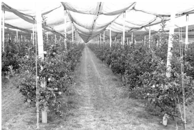
Integralna proizvodnja: savremen zasad jabuka (Mala Remeta)