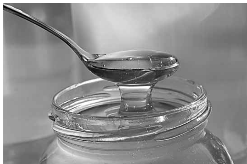
Med sa kašike ne sme da kaplje, već da teče sve tanje