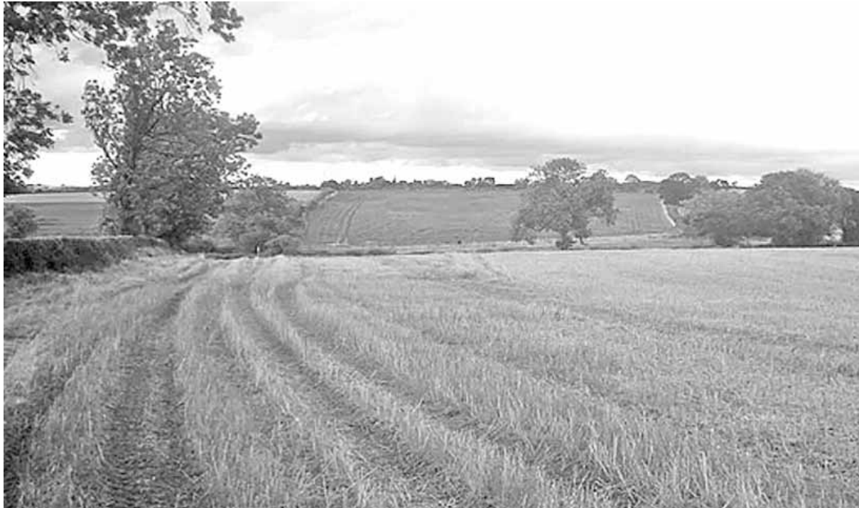
U parlogu više od 400.000 hektara

Selo i poljoprivreda su česte teme u javnom ispoljavanju društvenih, ekonomskih, a osobito političkih činilaca savremenog javnog mnjenja. Osim opravdanih i razumnih osvrta na bogatstvo društvenih i ekonomskih resursa, zapostavljenih u dugom vremenu tranzicije, nisu retki ni oni jednostrani, politikantski, zbnjunjući i računčijjski kojima se ponekad želi da opravda i učini beznačajnim potpuno devastiranje srpske ekonomije i gašenje industrijske proizvodnje koja je bila u znatnoj meri kompatibilna evropskoj, a bez koje nije moguć ni razvoj moderne agrarne proizvodnje. Pri svemu tome izostaje celovit pristup aktiviranju i zaustavljanju procesa propadanja najznačajnijeg i najmasovnijeg činoca agrarne proiz-