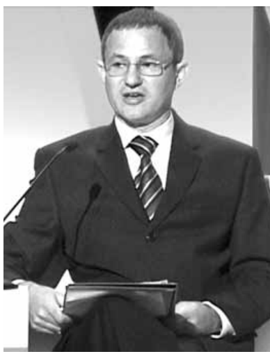
Ministar Glamočić na Konferenciji „Kvantni skok“

- Potencijali za ovaj način proizvodnje su ogromni, a nedovoljno iskorišćeni, rekao je Glamočić, ističući da poljoprivrednici sa malim posjedima, od dva do četiri hektara, imaju veliku komparativnu prednost za organsku proizvodnju, kao i da potencijali leže i u oko 500.000 hektara u zaštićenim prirodnom prostorima, kao i 1,4 miliona hektara pod livadama i pašnjacima. On je naglasio da je Ministarstvo poljoprivrede prepoznalo ulogu organske proizvodnje, ne samo u agraru, već i u ukupnom ekonomskom razvoju zemlje. Glamočić je zatim istakao da će uložiti maksimalne napore da zemljoradnicima olakša bavljenje tim vidom