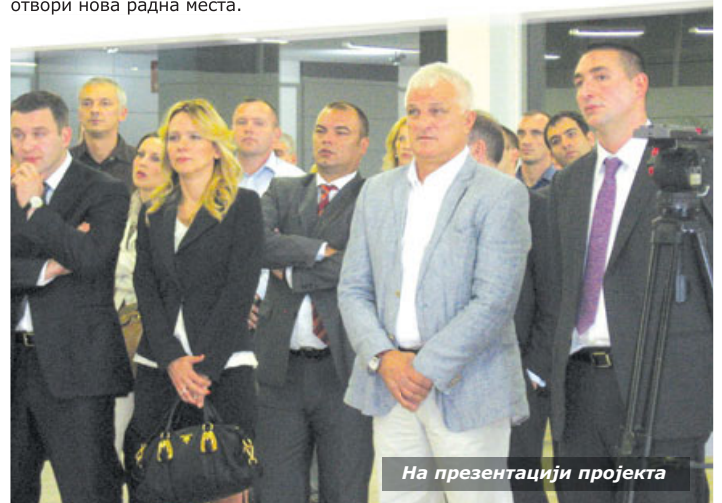
На презентацији пројекта