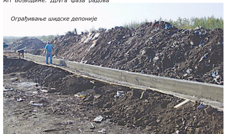
Ограђивање шидске депоније

УДРУЖЕЊЕ НОВИНАРА СРБИЈЕ • ФОНД „ДОБРИЦА КУЗМИЋ“ ЗА ПОМОЋ НОВИНАРИМА