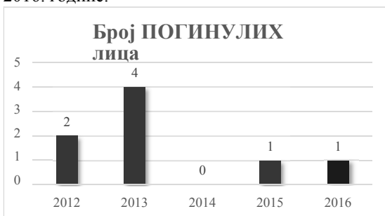
Слика број 1

На слици број 1 приказа је број погинулих лица у саобраћајним незгодама на путевима општине Ириг у периоди од 2012 – 2016. године.