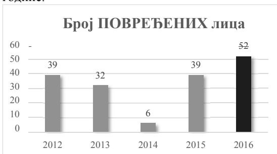
Слика број 2

На слици број 2 приказан је број повређених лица у саобраћајним несрећама на путевима у општини Дољевац за период 2012 – 2016. године.