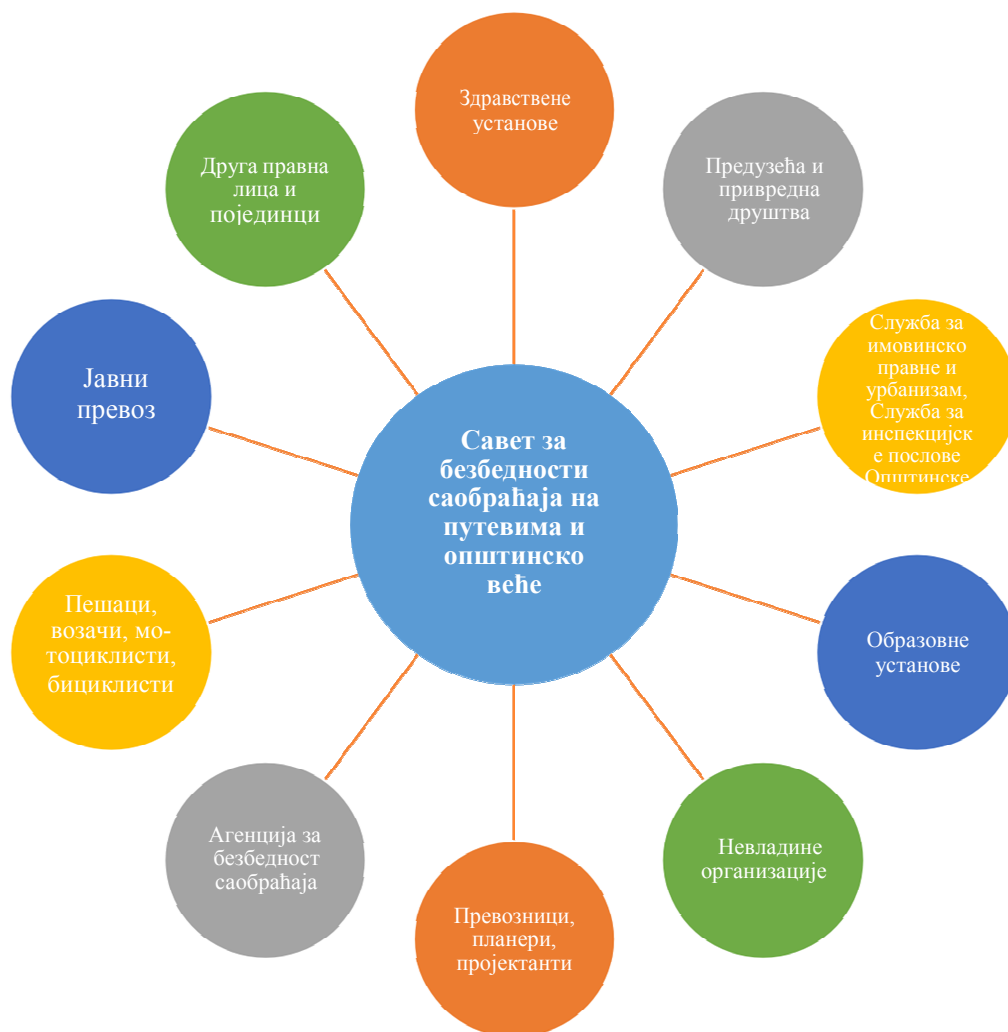
Слика број 3: Приказ шеме субјеката заинтересованих за безбедности саобраћаја

Доследно вршење основних делатности и на тај начин доприношење јачању система безбедности саобраћаја су оно што се очекује од свих субјеката. Поред тога, потребно је увести нове мере и активности, односно увести нове процедуре безбедности саобраћаја, што захтева унапређење послова безбедности саобраћаја и запошљавање нових кадрова који би били задужени за поједине аспекте саобраћајног система.