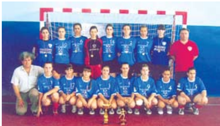
Рукометашице и стручни штаб Јединства са заслуженим признањима

Утакмицом између Јединства из Моровића и репрезентације рукометне лиге Срем-Јужна Бачка, у Моровићу је Јединство као првак ове лиге, промовисано у новог члана Војвођанске лиге где ће за противнике имати екипе из Суботице, Бајмока, Руског Крстура и Бачке Тополе.