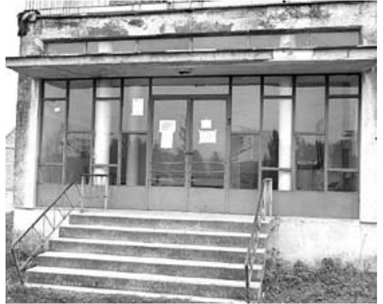
Зграда амбуланте у Сремској Рачи

НОВИ ПРОЈЕКТИ: СТРАДАЊЕ ЦИВИЛА У ДРУГОМ СВЕТСКОМ РАТУ