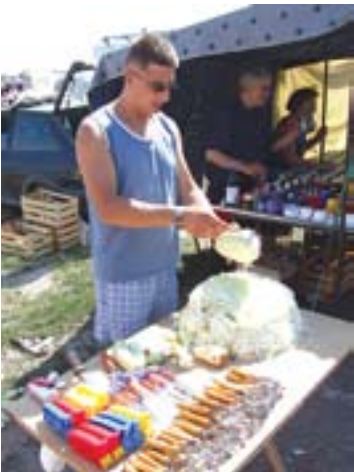
Сецко за купус чека муштерије