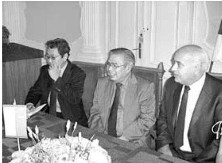
Са пријема у Градској кући

- У политичком смислу наше везе су увек биле добре, мора-