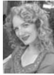
Пише: Милијана Барјактаревић