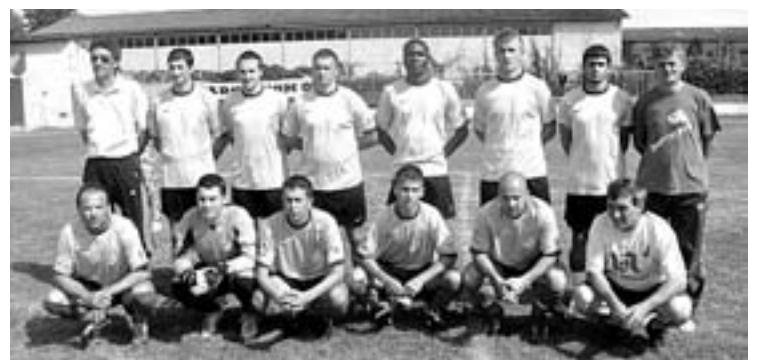
Раднички, домаћин и победник