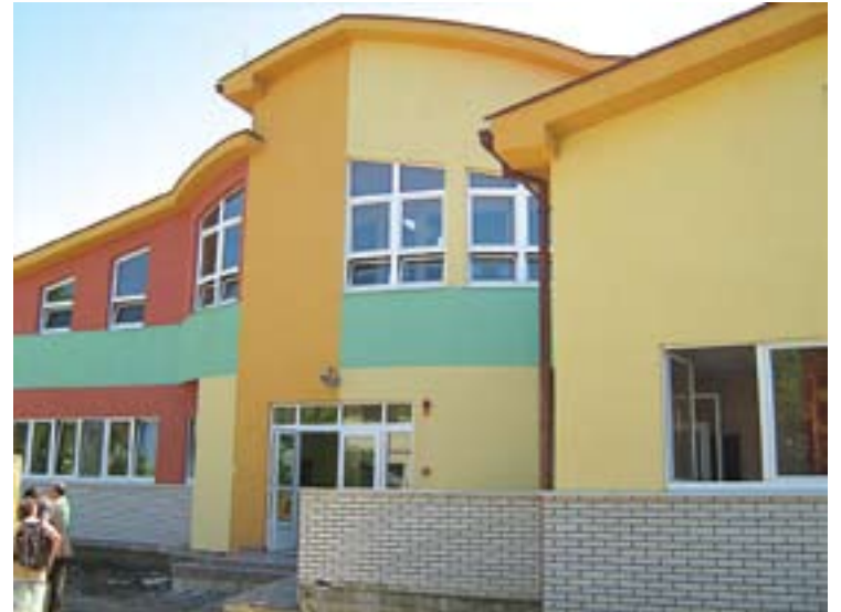
Нова зграда вртића