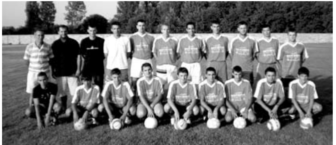
Играчи и руководство задовољни новим условима