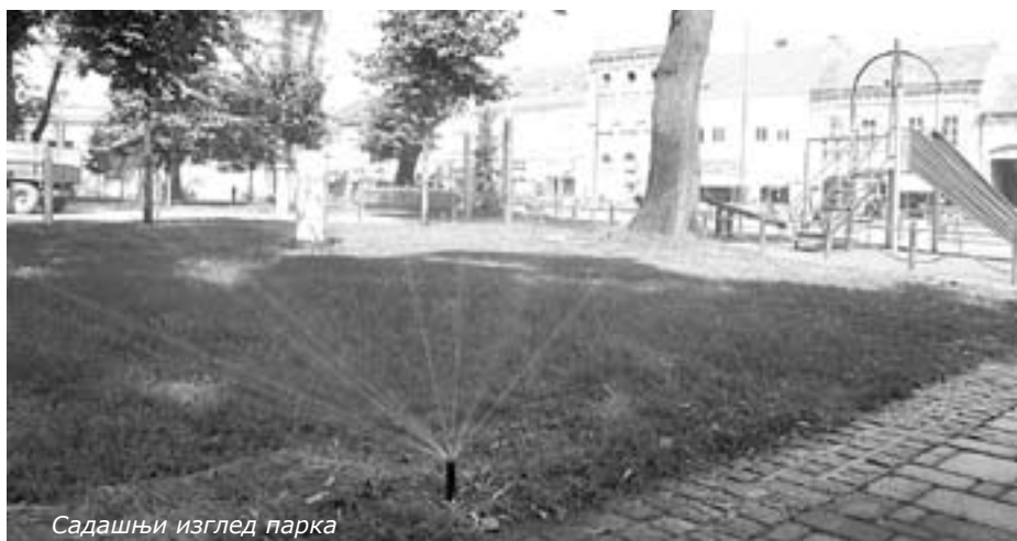
Садашњи изглед парка