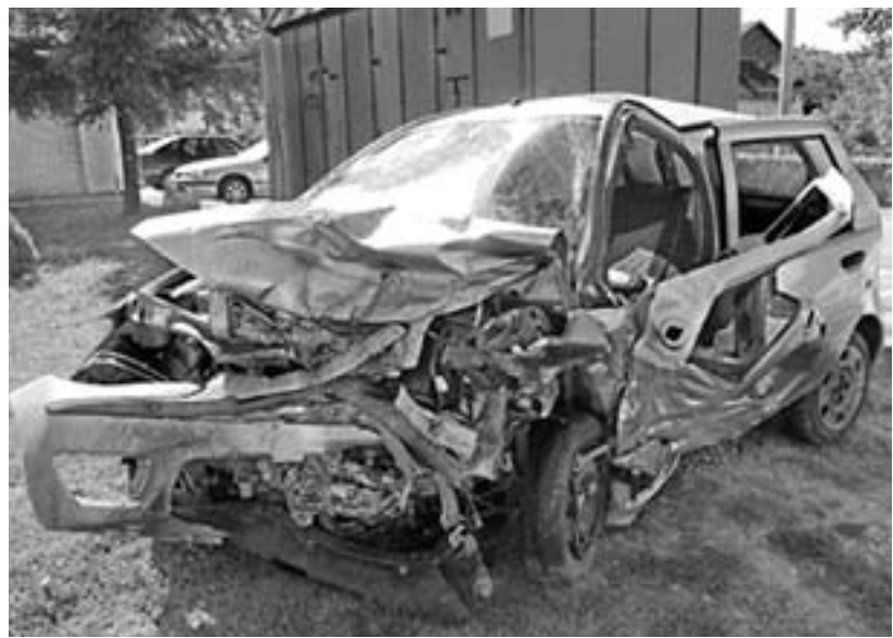
Застава потпуно уништена