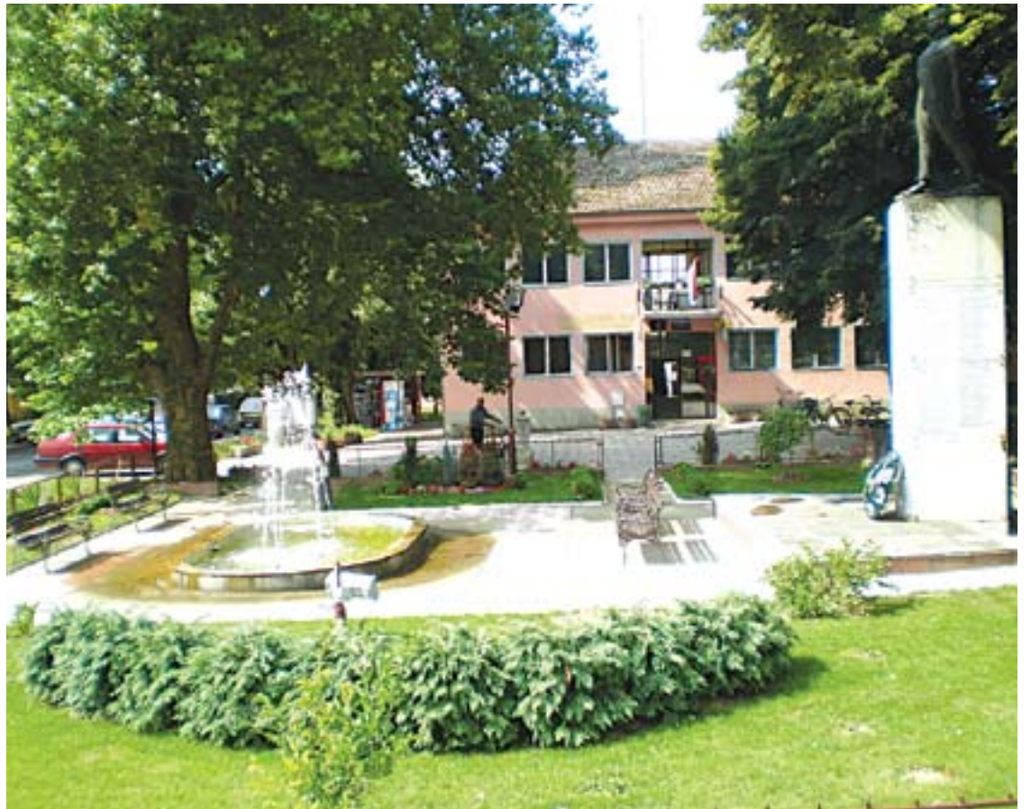
Центар Ердевика ових дана

- Ускоро треба да почнемо са радом на уређењу школских игралишта, којих имамо два. Старо рукометно које служи и за мали фудбал, и игралиште које смо урадили прошле године са тартан подлогом. Оно је једино у Срему и треће у Србији. На њима постоји расвета која је ту већ тридесетак