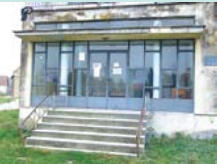
Зграда амбуланте у Сремској Рачи