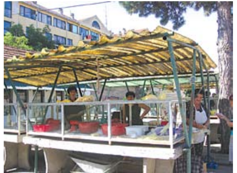
Продавачице сира на инђијској "белој пијаци"

- Ако нема политичке воље да се реши овако једно важно питање, један инспектор ту не може ништа. Може само да апелује на грађане да не купују намирнице животињског порекла на високим температу-