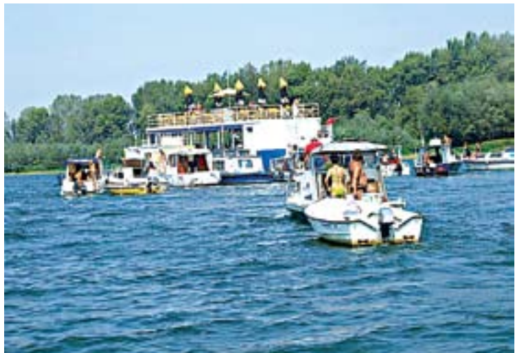
Детаљ са лањске регате

Пријаве и уплата котизације могу се извршити у МНК "Сава", Стари мост 66 у Сремској Митровици, сваким даном од 16 сати. Цена је 500 динара по особи, а ближе информације могу се добити телефоном на број 063-537-620.