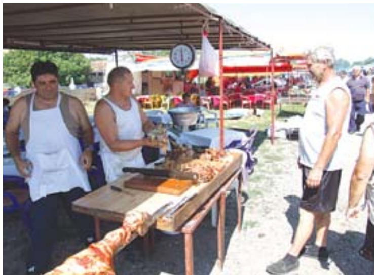
Јагњеће печење по хиљадарку

Као и на сваком вашару било је од свилених бомбона до трактора, прикључних и других пољопривредних машина и алатки, цица-бица ко зна за које потребе, сумњивог квалитета и порекла, и наравно неизбежних шатри са печеном јагњетином и прасетином. Гласна новокомпонована музика се подразумева. Чини се да су кафеције, иако печење није било јефтино, најбоље прошли на овом вашару. Јагњетина по килограму продавала се по хиљадарку, а прасетина за 300 динара мање. Муштерија је било подоста, јер какав би то био вашар ако се после куповине или кибицовања не седне, поједе и залије. Кило и кило. До следеће прилике. И новог кирбаја.