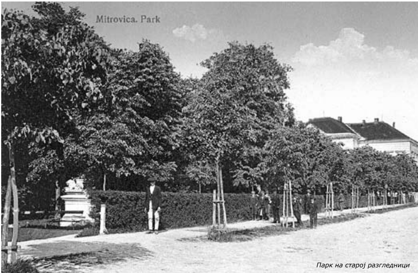
Парк на старој разгледници

На некадашњем војном вежбалишту и "параден плацу" пре око 140 година почело уређење парка. У митровачком парку постоји најстарије дрво гинка на овим просторима, а још из дана оснивања - хрст