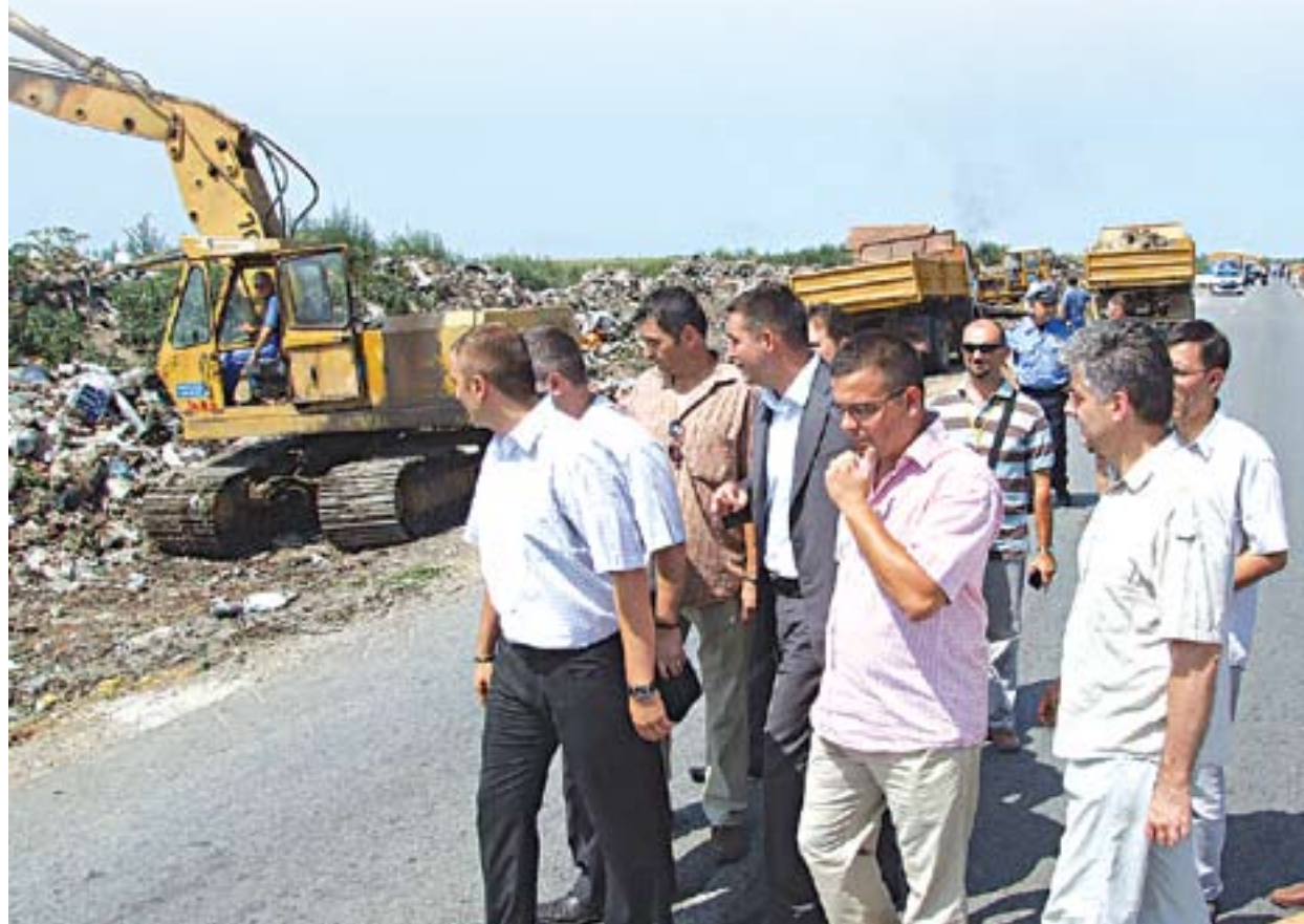
Депонија у Лаћарку је једна од највећих у Србији

У наредних двадесетак дана посао требао да буде окончан