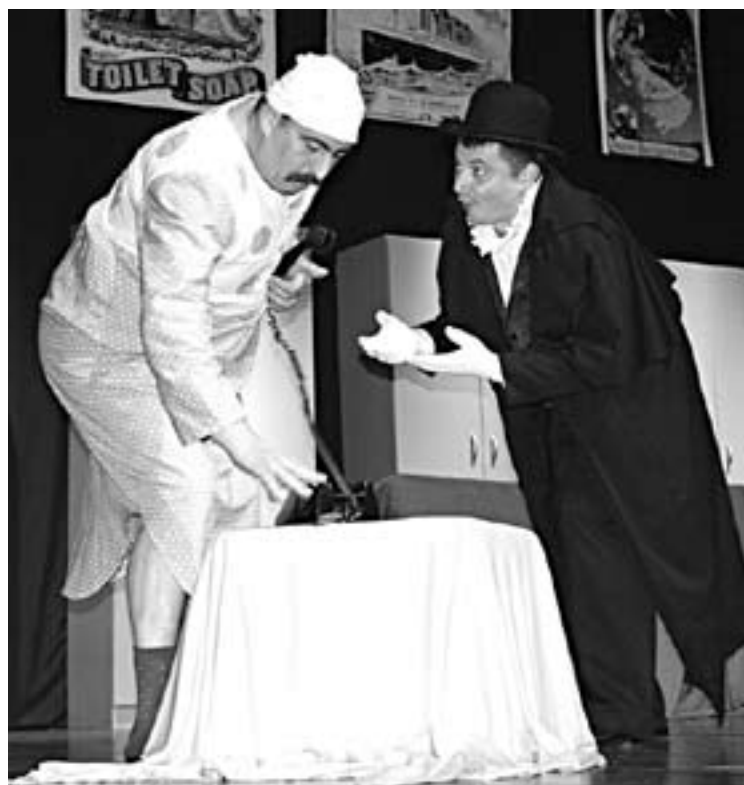
Из беочинске представе "Оскар"