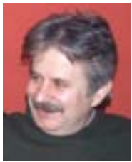
Пише: Душан Познановић