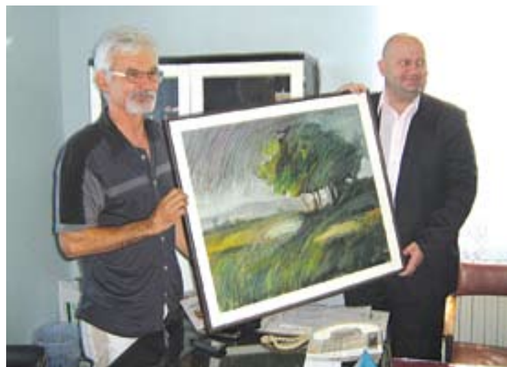
Поклон председнику, слика с Колоније „Водица“

историјски споменик културе, поред дворца „Шлос“ може сачувати у опусу културне баштине Голубинаца. Такође, он је изнео и планове новог месног руководства у вези изградње позоришне и спортске сале, као хрватског Дома где ће, своје просторије добити и ХПКД „Томислав“. Председник је обишао локације које су предвиђене за градњу ових објеката. Такође, обишао је и нову, велелепну зграду, модерног стила, вртића „Полетарац“ чија се изградња приводи крају. Затим, дворца „Шлос“ чија је рестаурација увелико одмакла, месну амбу-