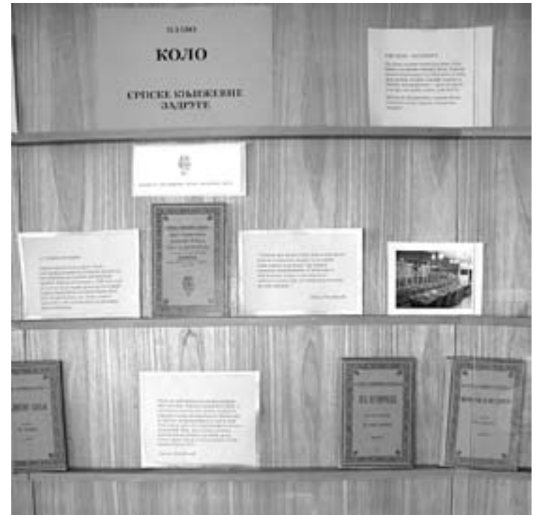
Изложене књиге "Плавог кола" СКЗ