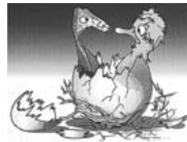
Детаљ са изложбе - "Гуштер"

"Свака слика је један прозор кроз који уметник комуницира са нама и кроз који ми завирујемо у његов свет, кроз те прозоре отварамо нова лична поља, путујемо кроз знања и незнана места и осећања".