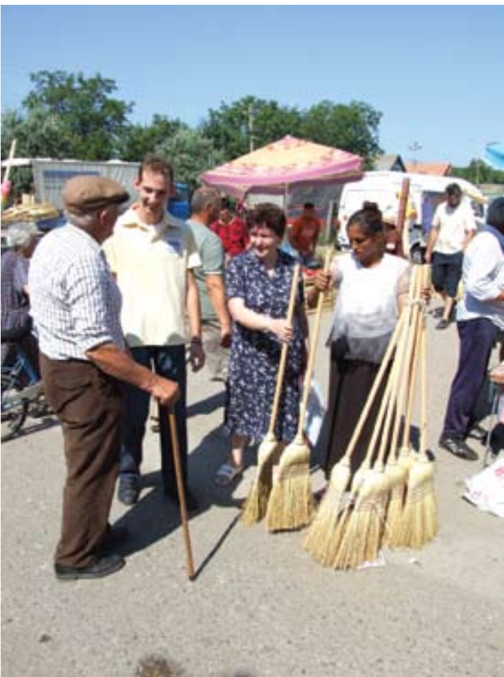
Метле по 100 динара

лог динара не мож' зарадити, јер нема више правих купаца. Ситниш у џепу, не звечи.