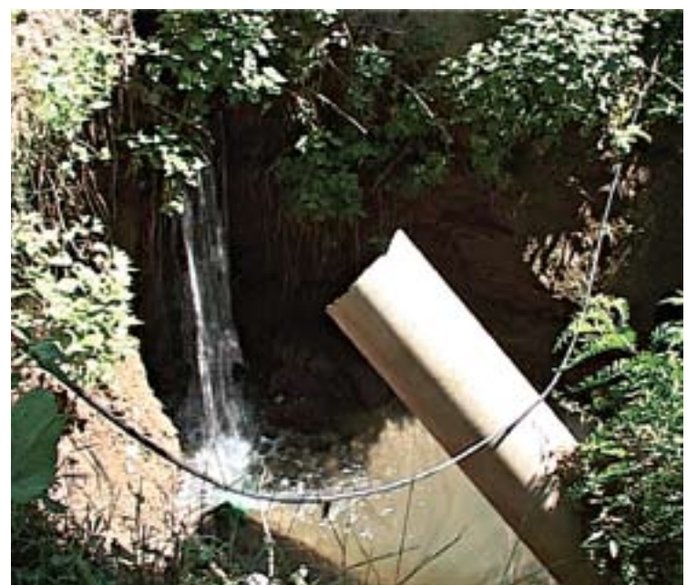
Мостић који се обрушио

Војводине“. Наша осматрачка служба редовно пријављује настале промене на насипу па је тако и овај случај пријављен и комуналној инспекцији и Водама Војводине – каже Дубљевић.