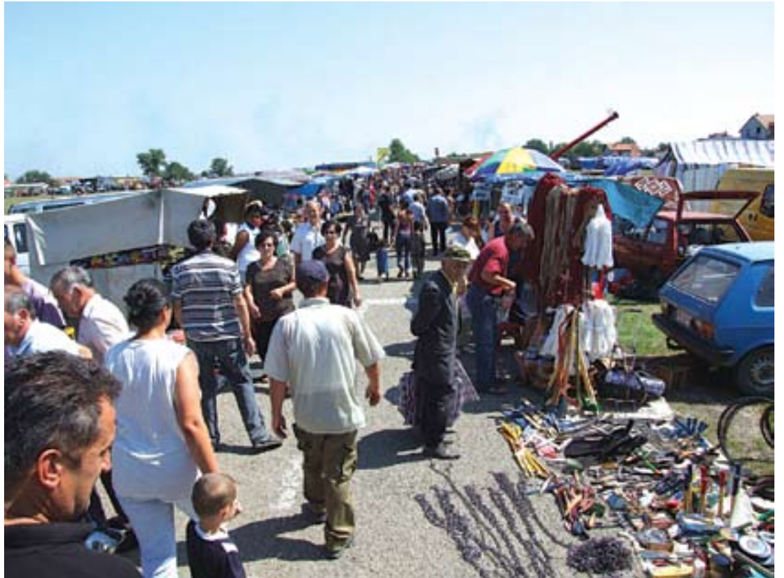
Понуда велика, купаца мало

–Пакујем се и идем кући. Дошао сам зарана и за цело пре подне продао три метле. Људи моји, каква су ово времена? Некада смо продавали и стотинак. Ко да више нико не чисти. А, метле дзабе, само сто динара, вајка се продавац из околине Шапца и каже да бе-